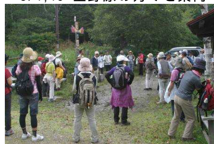
8/4, 19 上野原の方々を案内

上野原ふるさと自然観察会の皆さんに乙女高原を案内しました。2日間、それぞれ48人ずつでした。19日は途中で雷雨に見舞われましたが、幸い、ロッジの鍵を借りていたので大事に至ることはありませんでした。