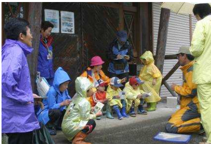
6/27 第8期マルハナバチ調べ隊

16名の参加者がありましたが、雨だったのでマルハナバチの紙芝居のみ行い、あとは雨の自然観察会に変更しました。