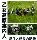
乙女高原ファンクラブ

(財)日本自然保護協会主催の「生物多様性の道プロジェクト」に応募しました。家のまわりや地域で、いつまでも大切に残していきたい自然を「生物多様性の道」として登録し、ずっと見守っていこうという活動です。さまざまな参加型の活動を企画し、たくさんの人たちと一緒に、日本中の生物多様性の保全に取り組んでいくと同時に、2010 年に名古屋で開催される生物多様性条約第 10 回締約国会議(COP10)の機会を最大限生かし、プロジェクトの成果を用いて生物多様性保全のための政策提言をしていくそうです。