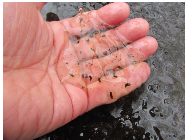
里地里山モニタリング2014 調査結果