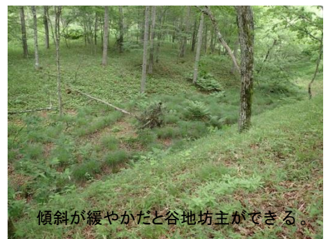
傾斜が緩やかだと谷地坊主ができる。