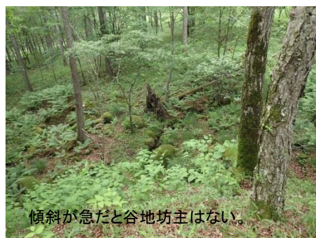
傾斜が急だと谷地坊主はない。

「ここが後半の観察場所です。昨年、ここで身体測定する谷地坊主を5つ決め、6月と8月に身体検査をしました。高さや幅を計ったのです。今日の観察会で今年の方の身体測定をし、昨年の記録と比べてみようと思っていたのですが、今日はやめます。ここから谷