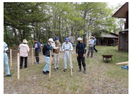
受付後、ロープ結びの練習

9時半から全体で打ち合わせを行いました。本来ならここで「はじめの会」をし、主催者あいさつなどをしますが、延期の場合は省略することに