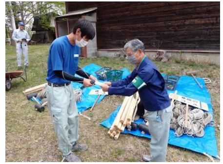
(株)田丸グリーン基金さんより