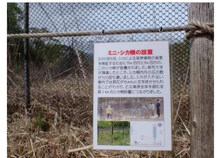
草原内の看板を探してね!