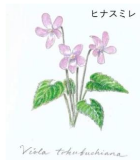
イラスト 高槻成紀さん

なお、乙女高原案内人でこの活動に賛同してくださる方は是非ご参加ください。1日だけ、半日だけでも結構です。事務局までご一報ください。