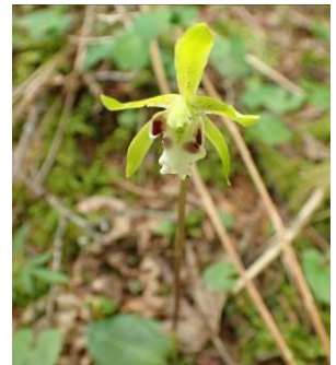
イチヨウラン。もし咲いていたら

私はいまだにイチヨウランの花に虫が訪れるのを見たことがありません。イチヨウランがどんな虫とつながりを持っているかをその場で確かめたいのに、その前に、無くなってしまうのが、残念でなりません。