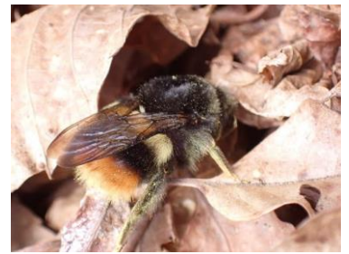
コマルハナバチの女王

ツノハシバミの雌花のその後が気になって観察したのですが、芽吹いたばかりの小さな葉の赤ちゃんにまぎれて、小さなハムシが交尾していました。たぶんおんなじハムシの交尾シーンを焼山峠のツノハシバミでも発見しました。きっとこのハムシとツノハシバミはとても深い関係にあると思います。ネットや図鑑『ハムシハンドブック』で調べましたが??です。一番それらしいのはズグロキハムシ。でも、「食草はイヌシデ、トサミズキ」とあり、ツノハシバミとは書いてないんですよ。ハムシの名前調べは宿題です。